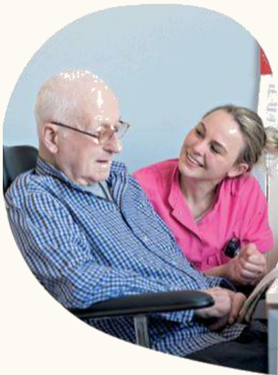
Schagen Mei 2019